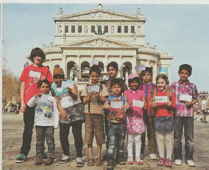
Erfolg oder Notlösung?: Freikarten für Dynamo Dresden und die Oper Faustaff, Kinder mit Kulturpass an der